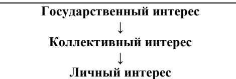
Рис. 1. Иерархия интересов в командно-административной экономике

В командно-административной экономике иерархия интересов экономических субъектов строится так, как показано на рисунке 1.