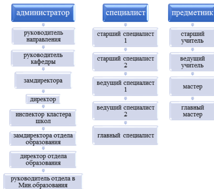
Схема 1. Возможности карьерного роста учителя в Сингапуре

Разумеется, оплата на каждой ступени выше, чем на предыдущей, чтобы стимулировать педагогов к активному выстраиванию своей карьеры и профессиональному росту, причем тарификационная сетка составлена таким образом, что размеры оплаты между тремя карьерными путями примерно одинаковы, и зарплата ведущего учителя приближается к зарплате директора школы. Учитывая, что общество Сингапура строится на меритократическом принципе управления, продвижение по карьерной лестнице может осуществляться быстро и зависит исключительно от желаний, усилий и компетентности самого педагога, а не субъективных мотивов и представлений его начальства. Возможности перехода на следующую карьерную ступень открываются официальным подтверждением у педагога определенного уровня компетенций,