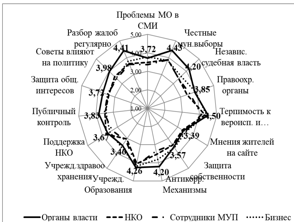
Рис. 2. Оценка работы институтов и механизмов МПП, баллы, Сакский муниципальный район, 2020

Но нам важно было оценить не просто работу институтов или механизмов МПП, но и их состоятельность (см. рис. 3). Этот показатель был рассчитан согласно критерию состоятельности институтов (механизмов) МПП, суть которого – в выявлении доли респондентов из всех групп, поставивших тому или иному институту наивысшие оценки в 4 или 5 баллов. В результате все оцененные институты (механизмы) МПП разбивались на 3 группы: состоятельные институты (механизмы) МПП , когда более 50 % респондентов дали высокие оценки