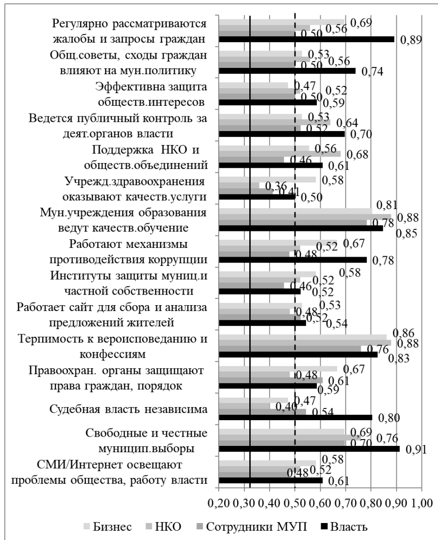
Рис. 3. Состоятельность институтов и механизмов МПП, оценки 4 групп респондентов, Сакский муниципальный район, 2020

Наблюдается внутренне дифференцированная специфика по оценке качества функционирования Общественных советов и сходов граждан, влияющих на муници-