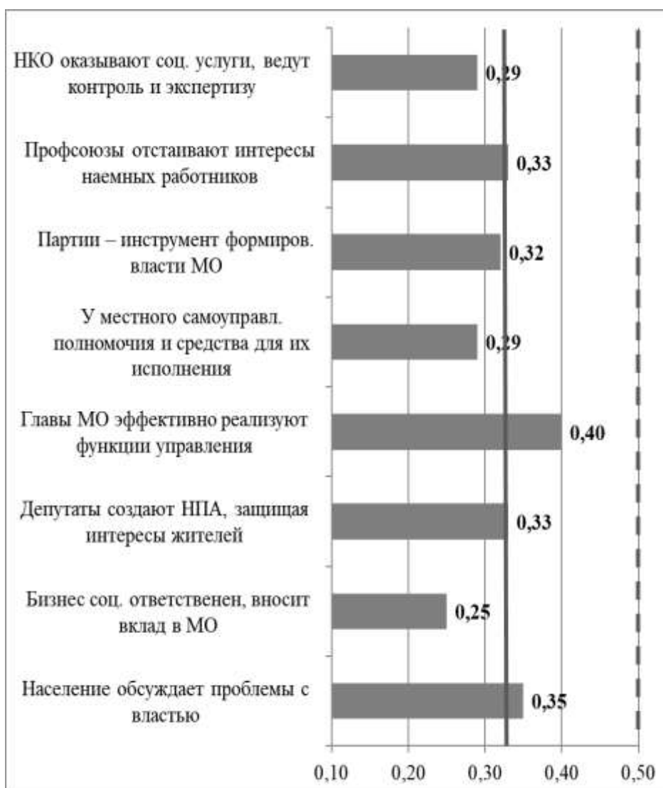
Рис. 5. Оценка функциональности субъектов и акторов МПП, октябрь 2020

МПП по критерию функциональности (определен аналогично критерию состоятельности институтов) приведена на рис. 5.