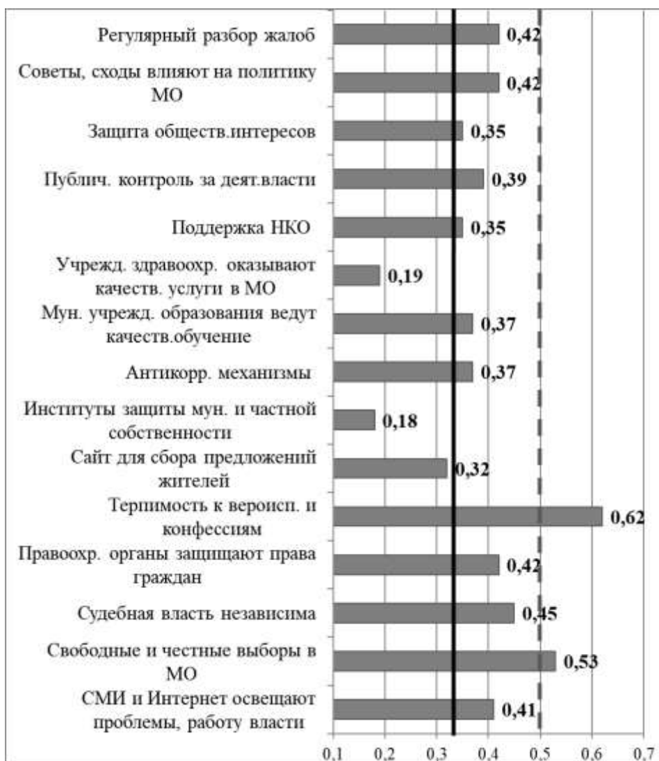
Рис. 3. Состоятельность институтов и механизмов МПП. Средняя оценка, 4 группы респондентов, Севастополь, октябрь 2020

Состоятельными являются институт терпимости к вероисповеданию и конфессиям, а также институт муниципальных выборов. Несостоятельными оказались институты защиты частной и муници-