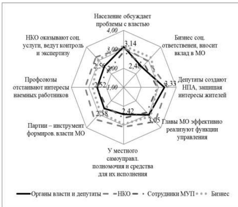
Рис. 4 Оценка работы субъектов и акторов МПП, баллы, Севастополь, октябрь 2020

пессимистичная оценка деятельности субъектов и акторов со стороны органов власти и сотрудников МУП (см. рис. 4).