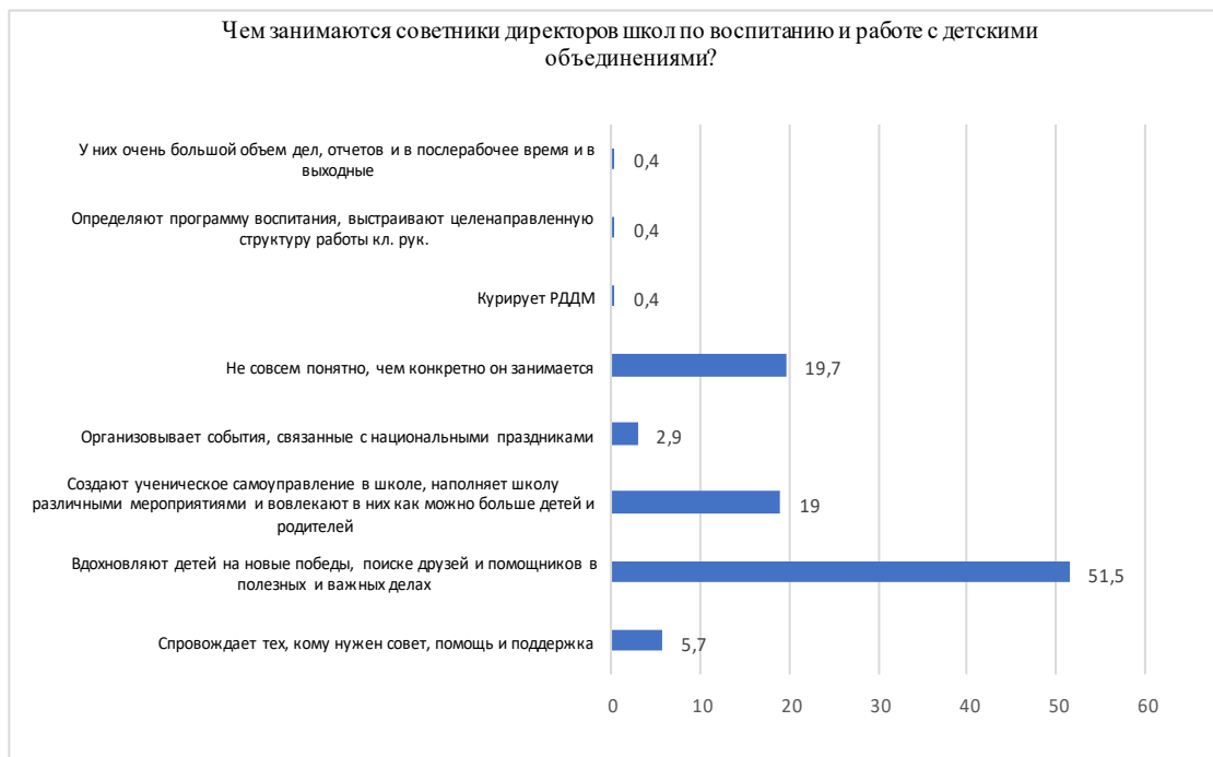
Рис. 1. Потребности в компетенциях советника руководителя по воспитанию и взаимодействию с общественными объединениями сотрудниками ОО (в %)

Анализируя полученные данные можно предположить, что большинство респондентов (51,5 %) предполагают, что советник должен обладать компетенцией, связанной с вдохновением детей на новые победы, поиск друзей и помощников в полезных и важных делах.