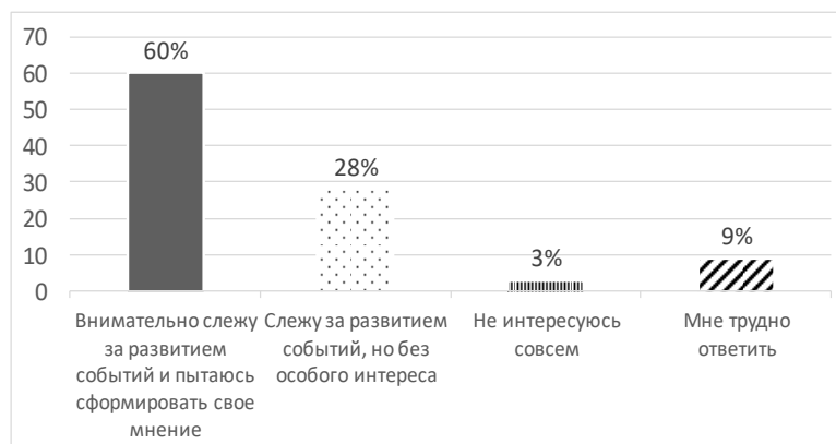
Рис. 3. Насколько вы заинтересованы происходящим в стране?

Рассмотрим вопрос, касающийся самоопределения респондентов: