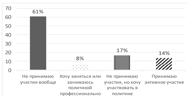
Рис. 1. Как Вы определяете свое отношение к участию в политической деятельности?

Второй из ключевых вопросов имел такую формулировку: «Какую роль граждане играют в политической жизни страны, по Вашему мнению?». Треть всех опрошиваемых (33 %) считает, что особое влияние на политическую сферу оказывают регулярно голосующие на выборах. При этом 52 % выбравших такой вариант являются поколением Z, а 48 % – поколением X. Как фактор развития политической системы выбрали уча-