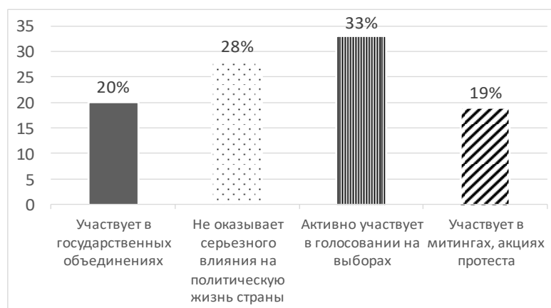
Рис. 2. Какую роль граждане играют в политической жизни страны, по Вашему мнению?

стие в митингах и акциях протеста 19 %, а участие в государственных объединениях – 20 %. Внушительное число респондентов (28 %) убеждены в том, что серьезного воздействия на политическую сферу граждане не оказывают вовсе. Состав ответивших распределяется следующим образом: 41 % – сторона поколения Z, 59 % – X поколение (см. рис. 2).